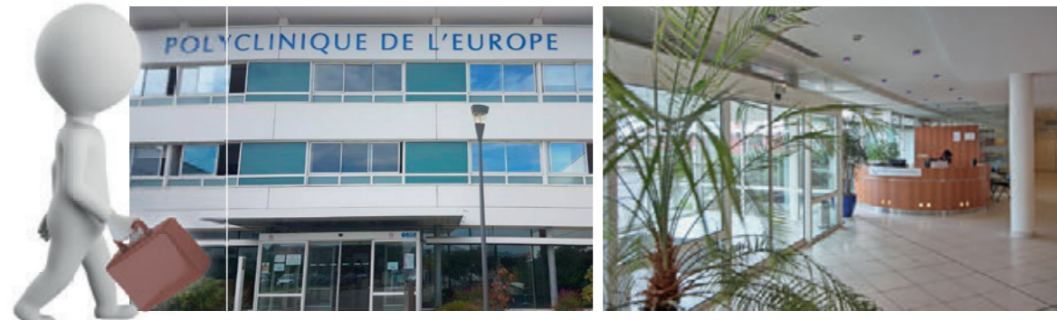
ARRIVÉE À LA POLYCLINIQUE - ACCUEIL