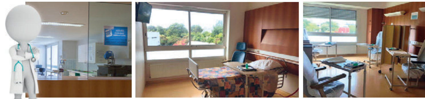
ACCUEIL SERVICE AMBULATOIRE ET INSTALLATION DANS VOTRE CHAMBRE