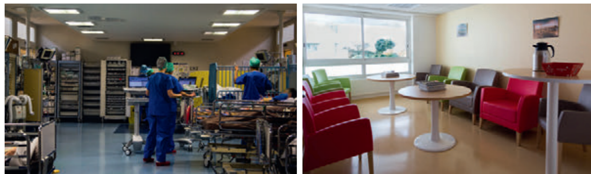
TRANSFERT AU BLOC PUIS EN SALLE DE RÉVEIL