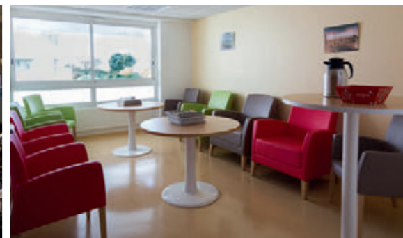
SALON D'ATTENTE AVANT LA SORTIE